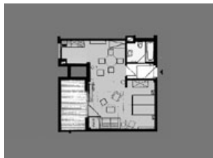
Appartement auf einer Ebene