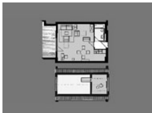
Appartement mit zwei Ebenen